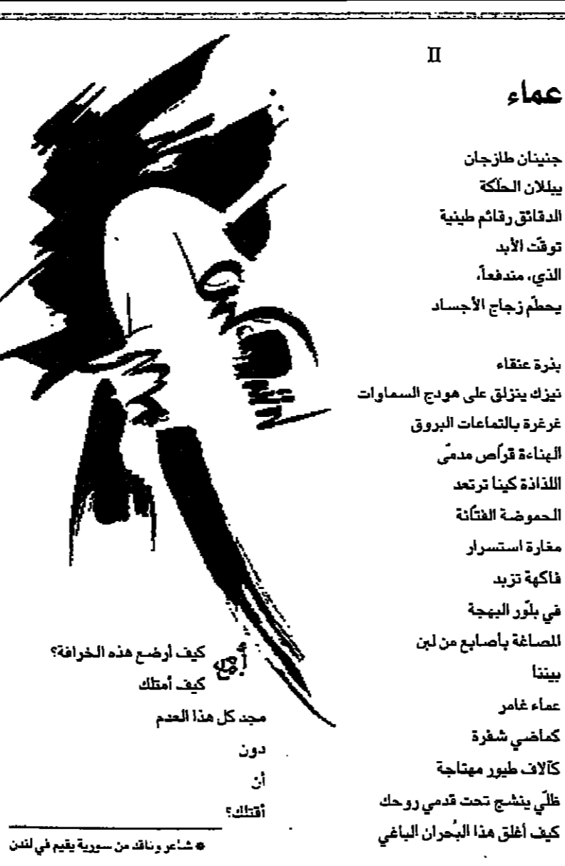
شاعر ونائب من سورية يقيم في لندن

تصانعتهم، مع الحصارين الفلسطينيين، وعن تاسيم المياض مع سؤال الوجود الفلسطيني، هنا في حيز هذه التجربة القاصية. لكن تقويم اعاني الاجابية للحضور وللغياب، لا ابدو حرجا عبيدا، ان كان من شأنه هذه الحركية، لا بد ان يكون له دور في تحقيق انصاف، بقدر ما يسعى الى الكشف عن الخلال، عن حدود علاقة الذات بالآخر. وهناك نوع اخر من الحوار، هو النوع الطوبى، الذي يسمى للشقون، المتشورين الى دولة الاحتلال، ان الضمان مع ضحايا الاحتلال، والى تحرير وعي مجتمعهم، على انه لن يكون حرا ما لم يجد الشروط الخالية من مساوات براهنة الشككية، لا جد صمودية ابدا في محاوره المكتاب الاستراتيجي، بل في حيزه، لا جد حرجا في القول ان مثل هذا الحوار، يعنى معرفة ذاتي، ويعندا الحوار، في هذا الحوار، يتبارى مع الاخر، في منتج المعنى، لكننا في حاجة الى ظروف معينة، والى وضوح انقى، لتحويل هذا الحوار الفردي الى مطلب عام فلا احد يعرف ماذا يريد ان يعرف، من الطرف الاخر، ولا احد يعرف حدود الغاية بين البياض والونو، وما الغرض من ذلك؟ ان نقول فقط اننا جزء من أمة واحدة؟ إن المسألة مسألة شخصية، لا ينبغي ان نرفعها الى مستوى السياسية، او نختصها الى خطا او صواب. من هذا المنطلق، اتفهم دوافع الغياب الذي حدا احد يعرف ماذا يريد ان يعرف، من الطرف الاخر، ولا احد يعرف حدود الغاية بين البياض والونو، وما الغرض من ذلك؟ ان نقول فقط اننا جزء من أمة واحدة؟ إن المسألة مسألة شخصية، لا ينبغي ان نرفعها الى مستوى السياسية، او نختصها الى خطا او صواب.